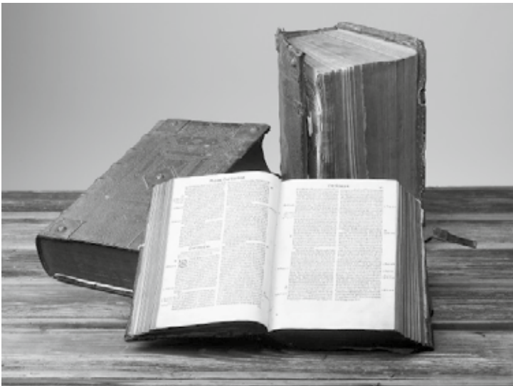
Drei Bibeln von 1553 (vorne), 1684 (hinten rechts) und 1739 (hinten links) vom Hof Haslebach.

Die Berner Obrigkeit lässt sich auch an der Disputation 1538 nicht überzeugen. Eine scharfe Verfolgung setzt ein. Zu den Opfern gehört auch Hans Haslebacher. Zwischen 1561 und 1569 sind mehrfach Bussen aktenkundig, die ihm und seinen Angehörigen auferlegt werden, weil er ein Täufer ist. 1571 wird er festgenommen und hingerichtet – als letzter Täufer im heutigen Kanton Bern.